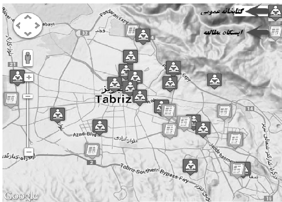
تصویر ۱. موقعیت کتابخانه‌های عمومی در شهر تبریز ۱

است که اکثر کتابخانه‌های عمومی این شهر در بخش مرکزی و شمال شرقی قرار دارند که این امر مؤید پراکنش غیرمنطقی و ناعادلانه این فضاها در سطح شهر است. تصویر ۱ پراکنش کتابخانه‌های عمومی در سطح شهر تبریز را نشان می‌دهد.