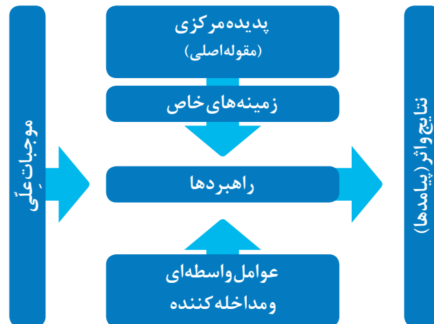
شکل ۱. الگوی پارادایمی در رویکرد نظام‌مند (فراستخواه، ۱۳۹۵، ص ۹۹)

این پژوهش به‌لحاظ هدف، کاربردی، از نظر نحوه گردآوری داده‌ها پژوهشی توصیفی (غیرآزمایشی) و از نوع «پیمایشی» است. همچنین، به‌لحاظ رویکرد یا ماهیت داده‌ها، به‌صورت «آمیخته» بوده و از طرح اکتشافی برای رسیدن به اهداف خود استفاده کرده است. به‌علاوه، در این مطالعه از روش نظریه زمینه‌ای ۱ استفاده شده است. از دیدگاه فراستخواه (۱۳۹۵)، یک پژوهشگر زمانی به‌سوی نظریه زمینه‌ای رهنمون می‌شود که در عرف علمی جای خالی یک نظریه احساس می‌شود. امروزه، رویکردهای مختلفی از نظریه زمینه‌ای توسعه یافته است که یکی از آن‌ها رویکرد نظام‌مند (سیستماتیک) است. در این پژوهش، از رویکرد نظام‌مند استفاده شده است که در شکل ۱ می‌توان الگوی پارادایمی آن را مشاهده کرد.