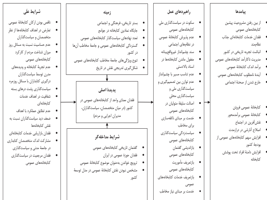
تصویر ۲. مدل پارادایمی فقدان معنای واحد از کتابخانه‌های عمومی در کشور

کتابخانه عمومی، کارکردها، مأموریت‌ها و خدمات آن دارند. با بهره‌گیری از کدگذاری محوری، مدل پارادایمی فقدان معنای واحد از کتابخانه‌های عمومی، شرایط علی آن، شرایط مداخله‌گر، زمینه، راهبردهای عمل و در نهایت پیامدهای به‌کارگیری راهبردها در تصویر ۲ نشان داده شده است.