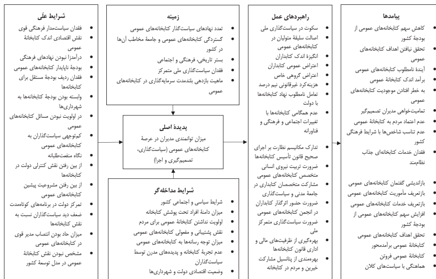
تصویر ۴. مدل پارادایمی میزان توانمندی مدیران در عرصه کتابخانه‌های عمومی

در ادامه، روایتی توصیفی از پدیده مرکزی ارائه می‌شود که به آن «داستان» گفته می‌شود. این داستان سپس در خصوص پدیده مرکزی مفهوم‌سازی می‌شود که هدف آن دست یافتن به «یکپارچگی» است (محمدپور، ۱۳۸۹).