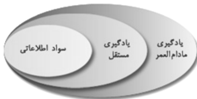
نمودار ۱. رابطه سواد اطلاعاتی، یادگیری مستقل و یادگیری مادام‌العمر

اندرتا ۸ (۲۰۰۴) نیز این مطلب را تأیید می‌کند و معتقد است که مهارت‌های سواد اطلاعاتی باید زیربنای یادگیری الکترونیکی باشد تا یادگیری مستقل را بنیان نهاد و دانشجویان را به یادگیری مادام‌العمر علاقه‌مند کند و آنها را برای اتخاذ تصمیمات آگاهانه آماده نماید تا از عهده سنگینی بار اطلاعات برآیند. بدون مهارت‌های سواد اطلاعاتی، افزایش و گسترش سریع اطلاعات و منابع بار سنگینی است که می‌تواند به تنفر و بی‌زاری فراگیران منتهی شود (نمودار ۱).